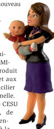
Illustration : Christelle Mékajian

Premier à proposer en 1996 une solution simple pour accéder aux services à la personne à domicile, le CHEQUE DOMICILE émet un produit moderne qui permet aux bénéficiaires de concilier travail et vie personnelle. Le Chèque Domicile CESU crée du bien-être, de l'harmonie dans l'entreprise et procure à la fois des avantages financiers, fiscaux et socioéconomiques.