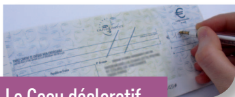
Le Cesu déclaratif

Pour payer vos prestations de services à la personne, tout mode de paiement classique est accepté. Mais pensez aussi au Chèque emploi service universel (Cesu).