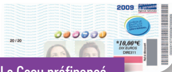
Le Cesu préfinancé